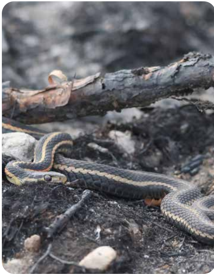
Red-sided garter snake

The Species at Risk (NWT) Act (the Act) provides a process to identify, protect and recover species at risk in the Northwest Territories (NWT). The Act applies to any wild animal, plant or other species managed by the Government of the Northwest Territories. It applies in most areas of the NWT, on both public and private lands, including private lands owned under a land claims agreement.