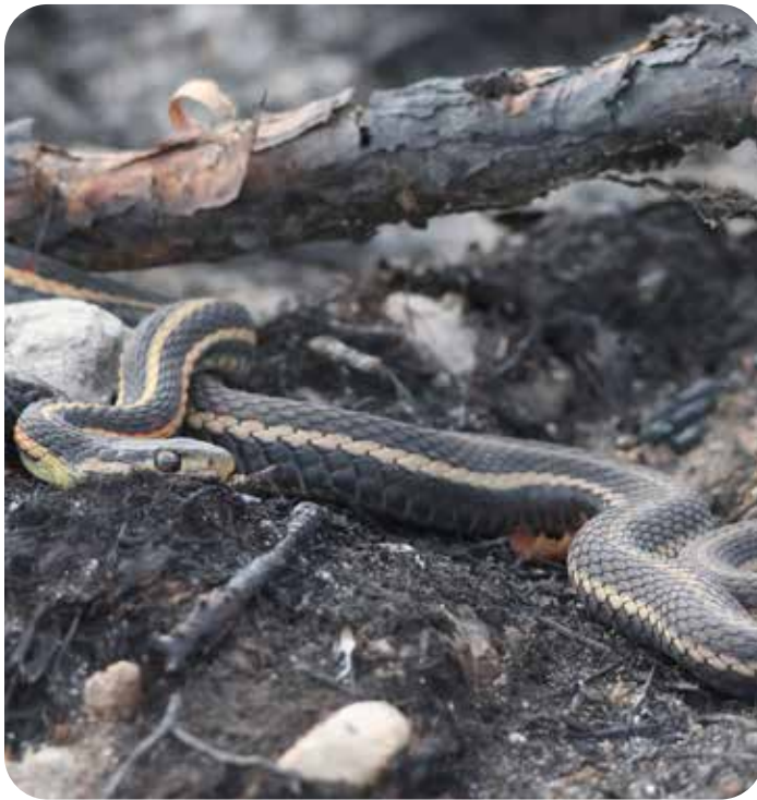
Couleuvre rayée à flanc rouge – Photo : Peter Lin

La Loi sur les espèces en péril (TNO) [la Loi] prévoit un processus pour identifier, protéger et rétablir les espèces en péril aux Territoires du Nord Ouest (TNO). La Loi s'applique à toute espèce sauvage animale ou végétale qui est gérée par le gouvernement des Territoires du Nord-Ouest. En outre, elle s'applique dans la plupart des régions des TNO, tant sur les terres publiques que sur les terres privées, y compris les terres privées visées par un accord de revendications territoriales.