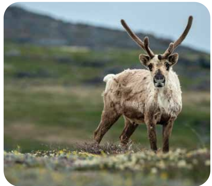
Caribou de la toundra, harde de Bathurst

Le Comité sur les espèces en péril reçoit l'ensemble de son soutien administratif et financier du ministère de l'Environnement et du Changement climatique du gouvernement des Territoires du Nord Ouest. Les avis de contrats pour la rédaction des rapports de situation des espèces sont publiés au contracts.opennwt.ca .