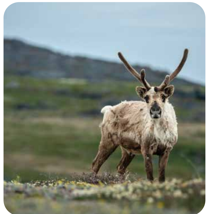
Bathurst barren-ground caribou

The Department of Environment and Climate Change, Government of the Northwest Territories, provides full administrative and financial support to the Species at Risk Committee. Contracts for preparing species status reports are advertised on contracts.opennwt.ca .