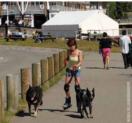
GOUVERNEMENT DU YUKON