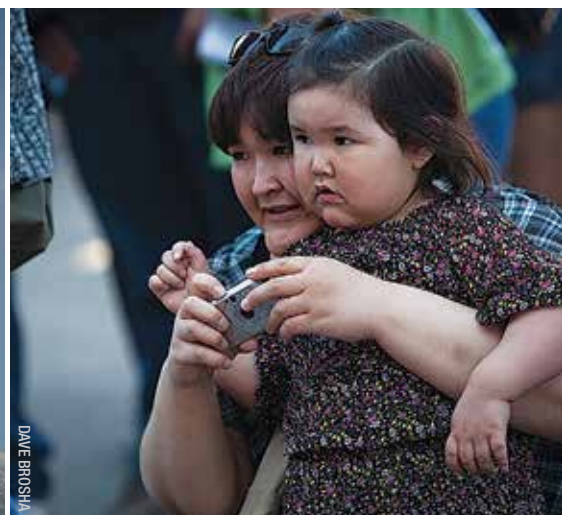
GOUVERNEMENT DU NUNAVUT