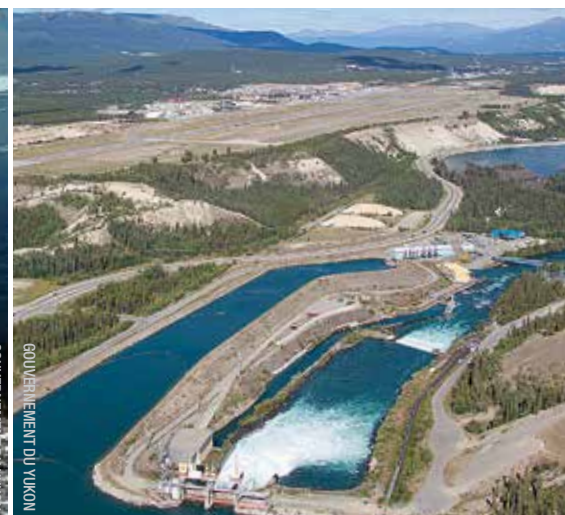
GOUVERNEMENT DU YUKON